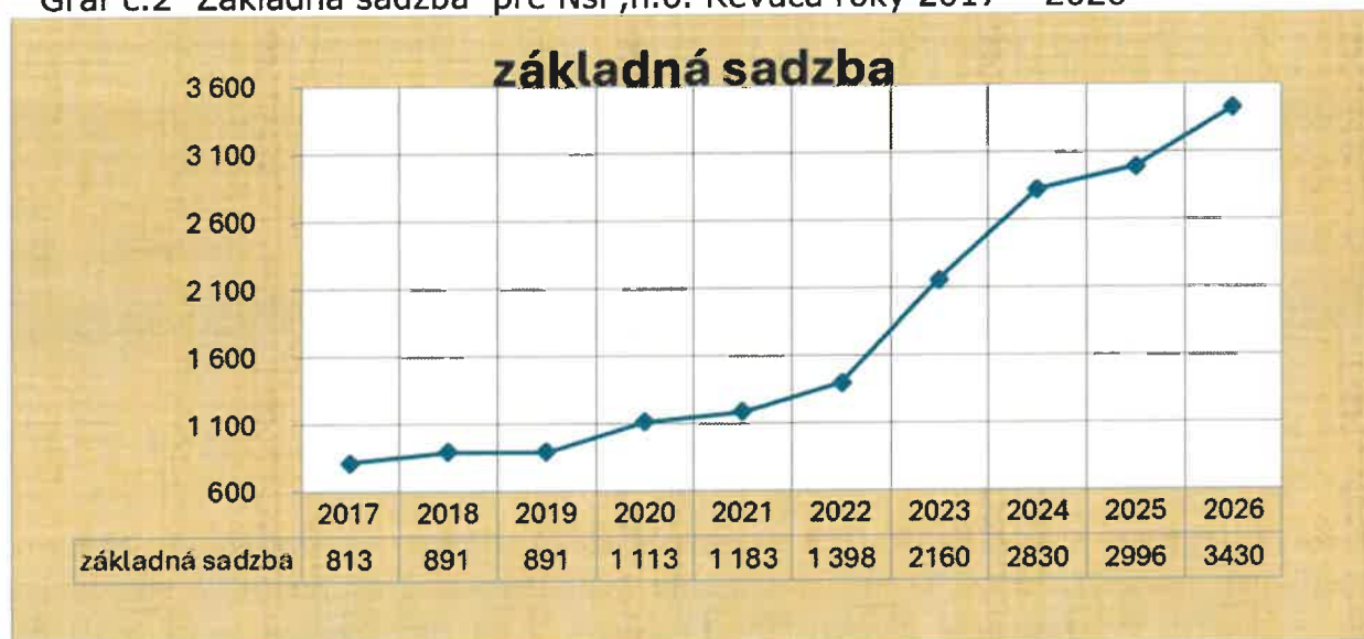
Graf č.2 Základná sadzba pre NsP,n.o. Revúca roky 2017 – 2026

Základná sadzba je suma v absolútnej hodnote, ktorá je uhrádzaná v systéme DRG za jednotlivý prípad s relatívnou váhou 1,0. Cena za hospitalizačný prípad sa vypočíta vynásobením základnej sadzby efektívnou relatívnou váhou hospitalizačného prípadu s prípadným pripočítaním ďalších položiek podľa katalógu prípadových paušálov.