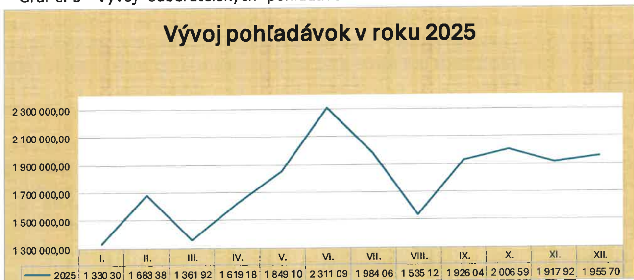
Graf č. 3 Vývoj odberateľských pohľadávok v roku 2025

Vývoj pohľadávok a celkové výkyvy v mesiacoch vyplývali z platieb od zdravotných poisťovní. Pokiaľ zdravotná poisťovňa Dôvera uhradila pohľadávky za zdravotnú starostlivosť pred lehotou splatnosti, koncom mesiaca pred mesiacom